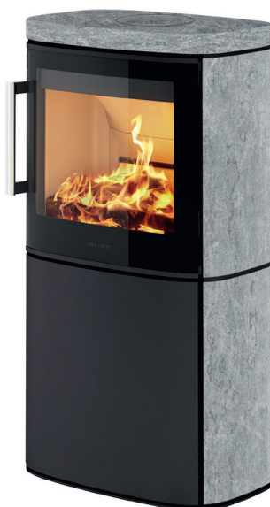
HWAM 4640m con rivestimento in pietra ollare